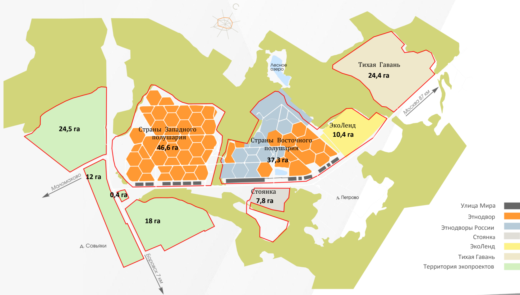
Схема территории ЭТНОМИРА